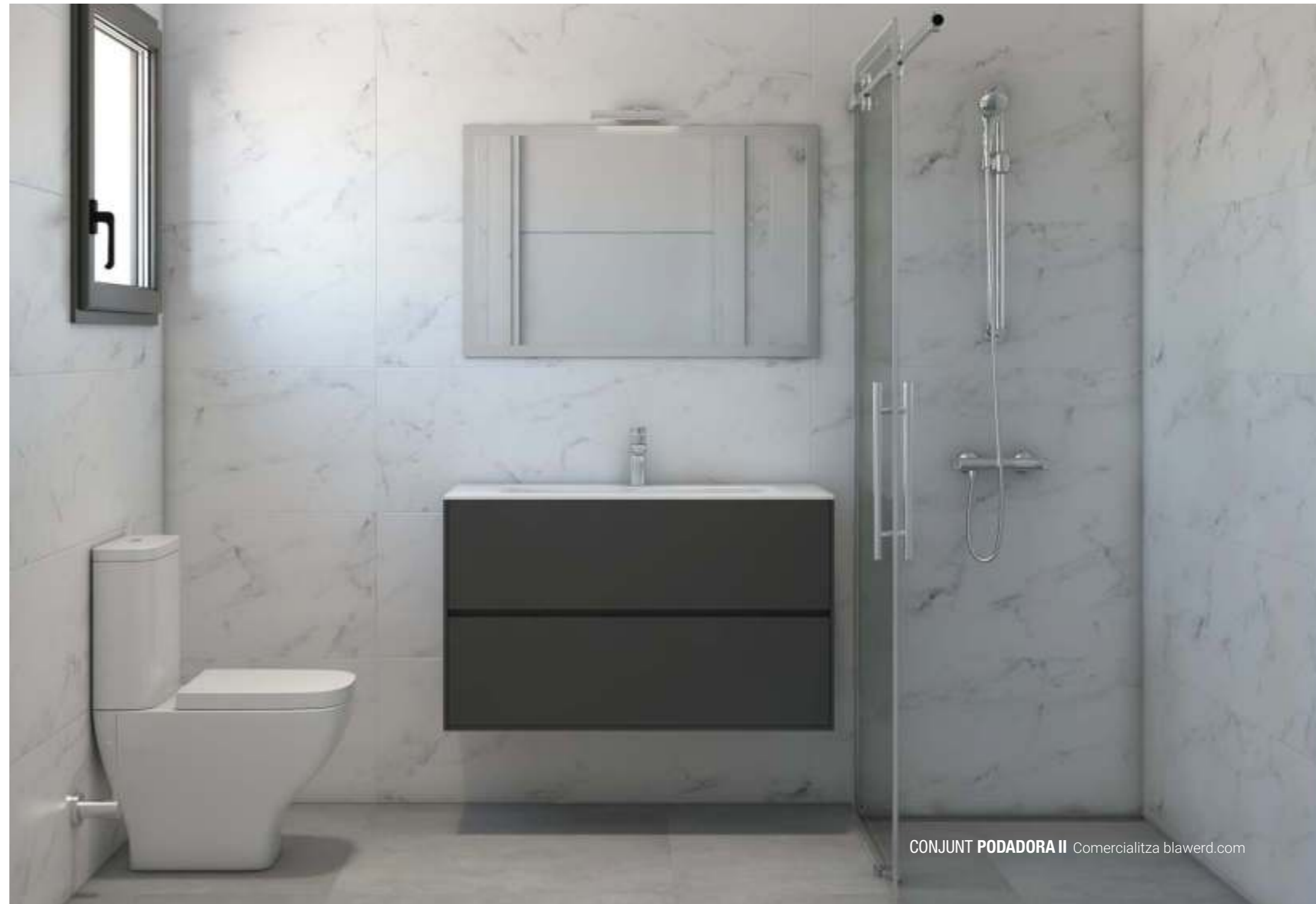
CONJUNT PODADORA II Comercialitza blawerd.com