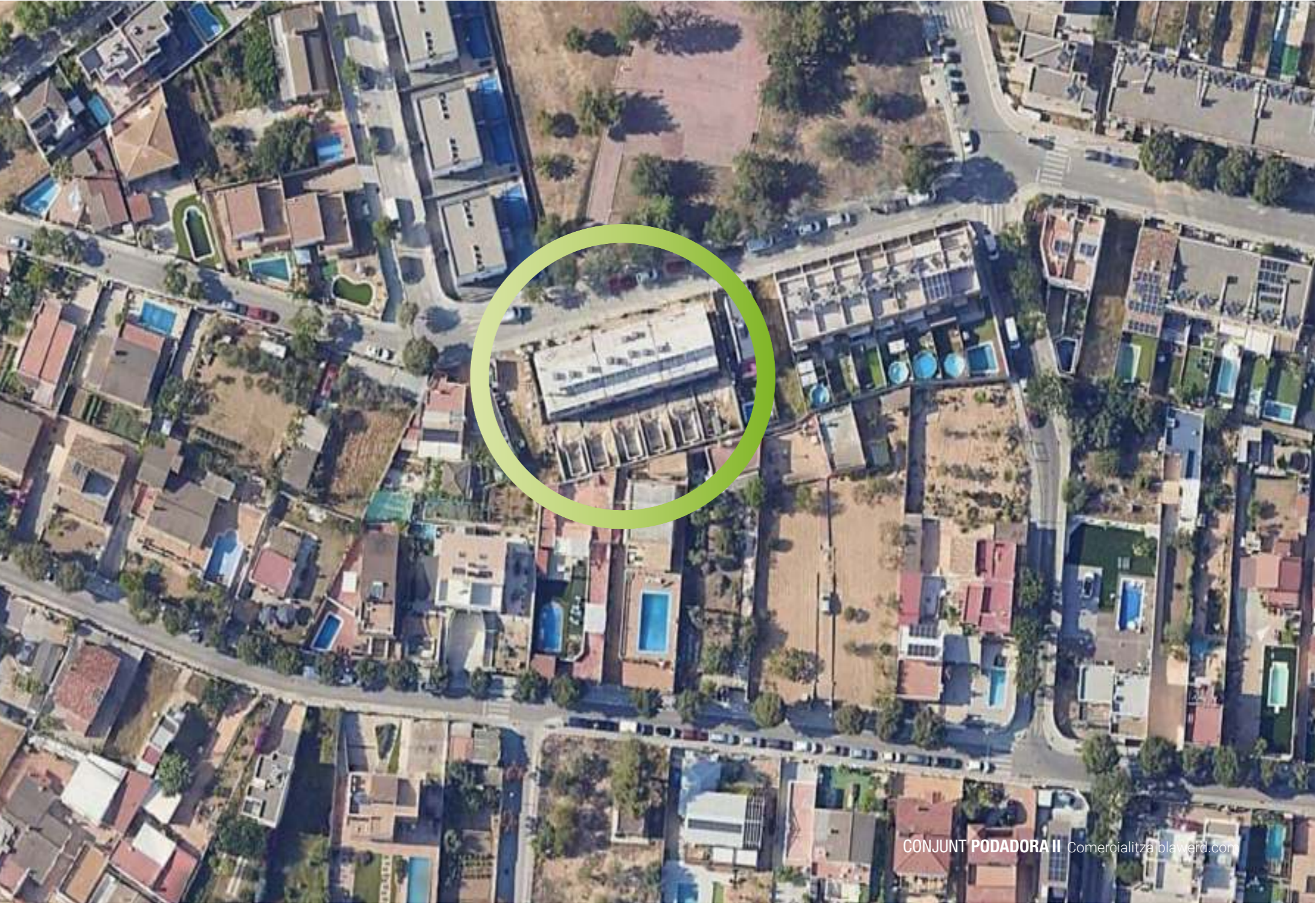
CONJUNT PODADORA II Comercialitza blawerd.com