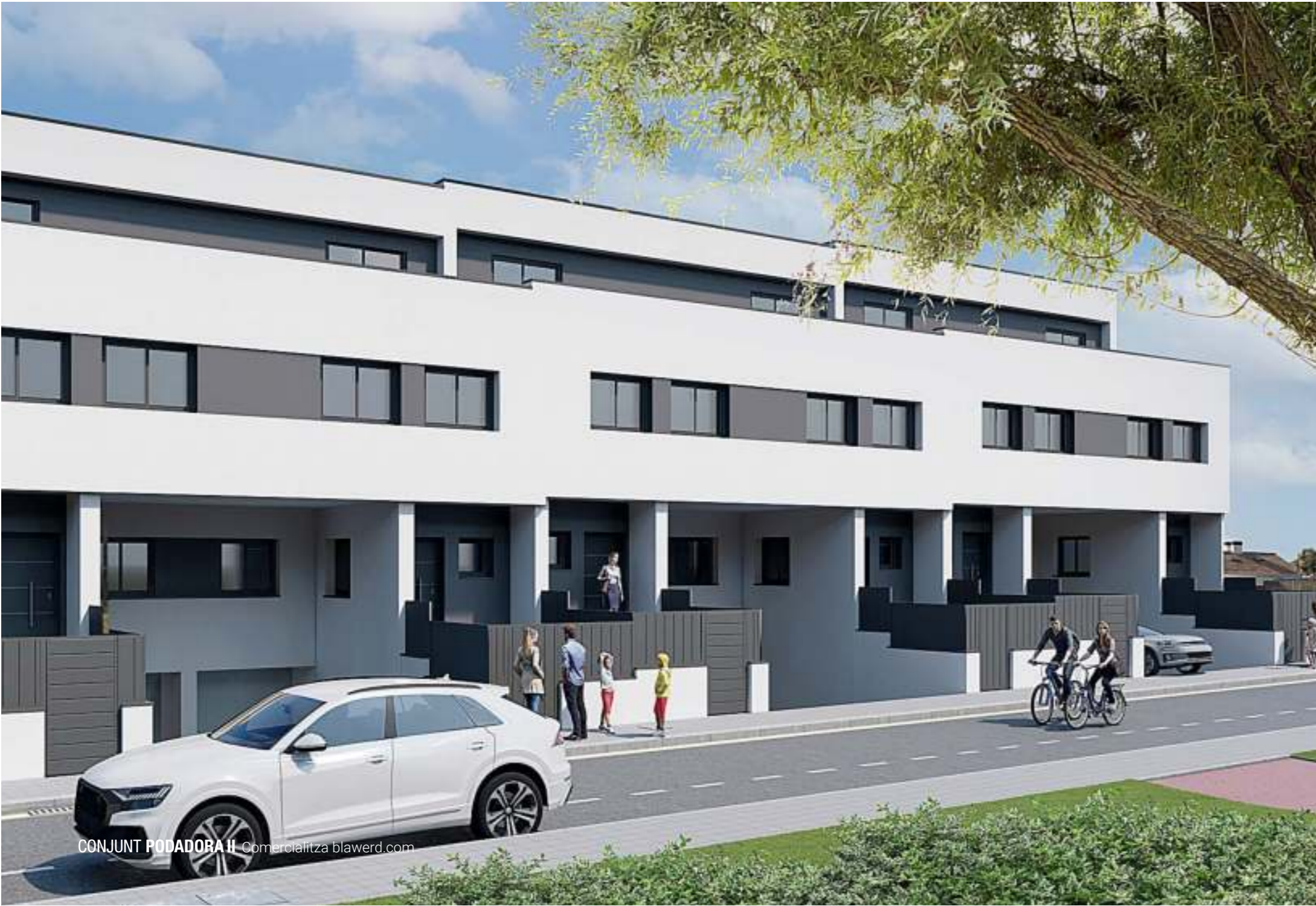
CONJUNT PODADORA II Comercialitza blawerd.com